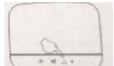
Aanwijzing knop geurverspreider