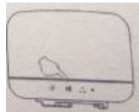
Aanwijzing knop Bluetooth modus

Schakel het zoeken naar Bluetooth-apparaten "SHS1618" in, waarmee na het matchen muziek kan worden afgespeeld. Als u het lange tijd niet gebruikt, moet u het water uit de watermassa van de tank droog laten lopen en het dan goed bewaren. Als je het wilt gebruiken, gebruik dan het neutrale schoonmaakmiddel om het water nogmaals te reinigen, en dan kunt u het gebruiken.